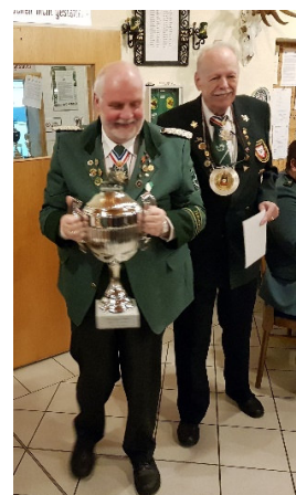
Der König der Alten Gaardener Gilde nimmt den Pokal entgegen