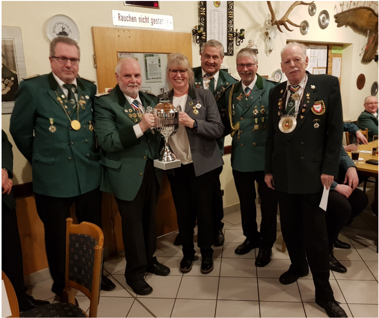
Die Mannschaft und der Kreisvorsitzende mit dem Pokal

Der Abend nahm bei Bier, Sekt und Gesprächen weiterhin einen harmonischen Verlauf.