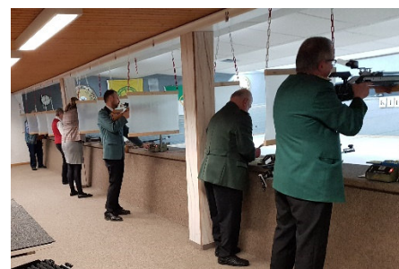
Die ersten Schützen